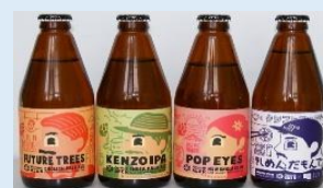
ブルーパブおおぞね