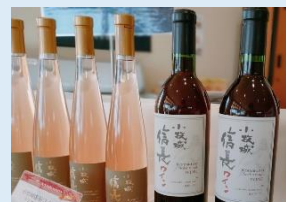
小牧ワイナリー カフェ