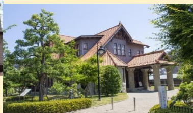
文化のみち 二葉館