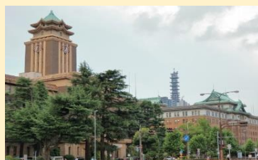
愛知県庁と名古屋市役所