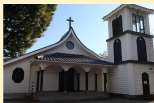
カトリック主税町教会